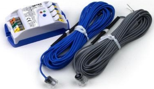
[OS-12C 사진] 안전빔

[적용] 손을 사용할수없는경우 발을 이용하여 문열림 신호는 주는방식 (병원의 수술실에 적용)