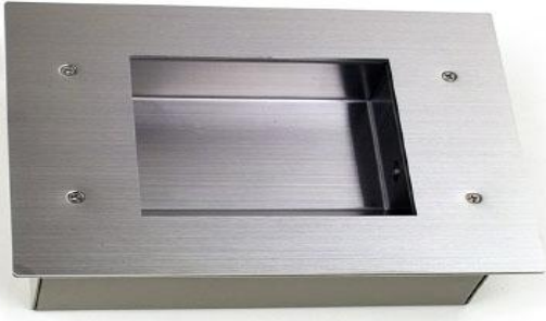
[FS-10P사진] 발 판